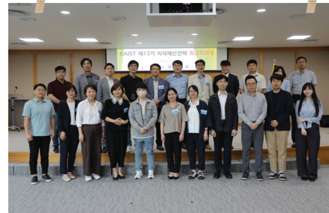
특허법원 견학 I