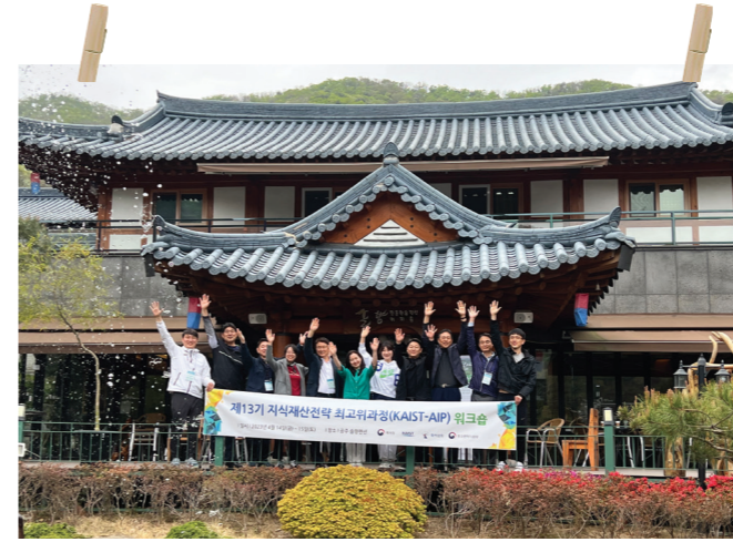
KAIST-AIP Workshop I