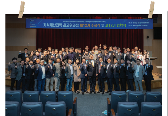
수료식 및 입학식