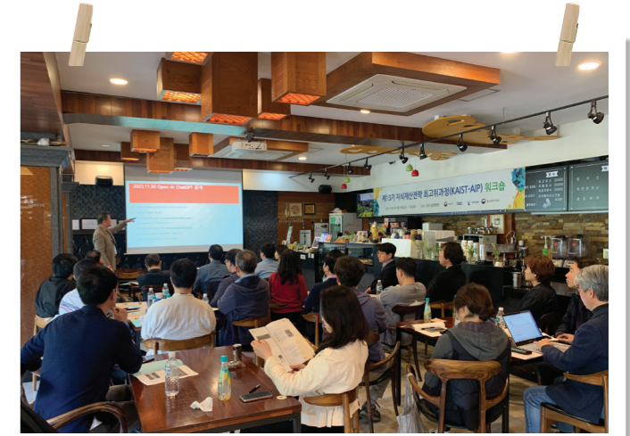
KAIST-AIP Workshop II