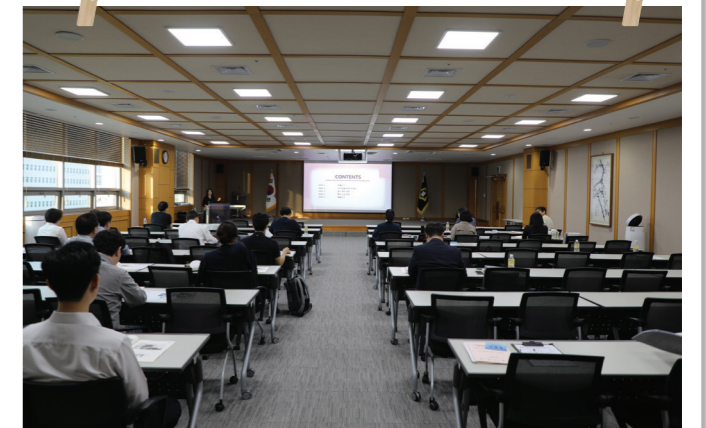
특허법원 견학 II