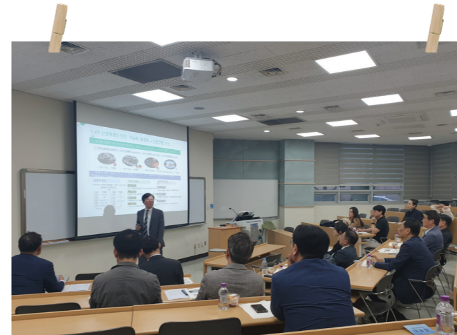
KAIST-AIP Open Class